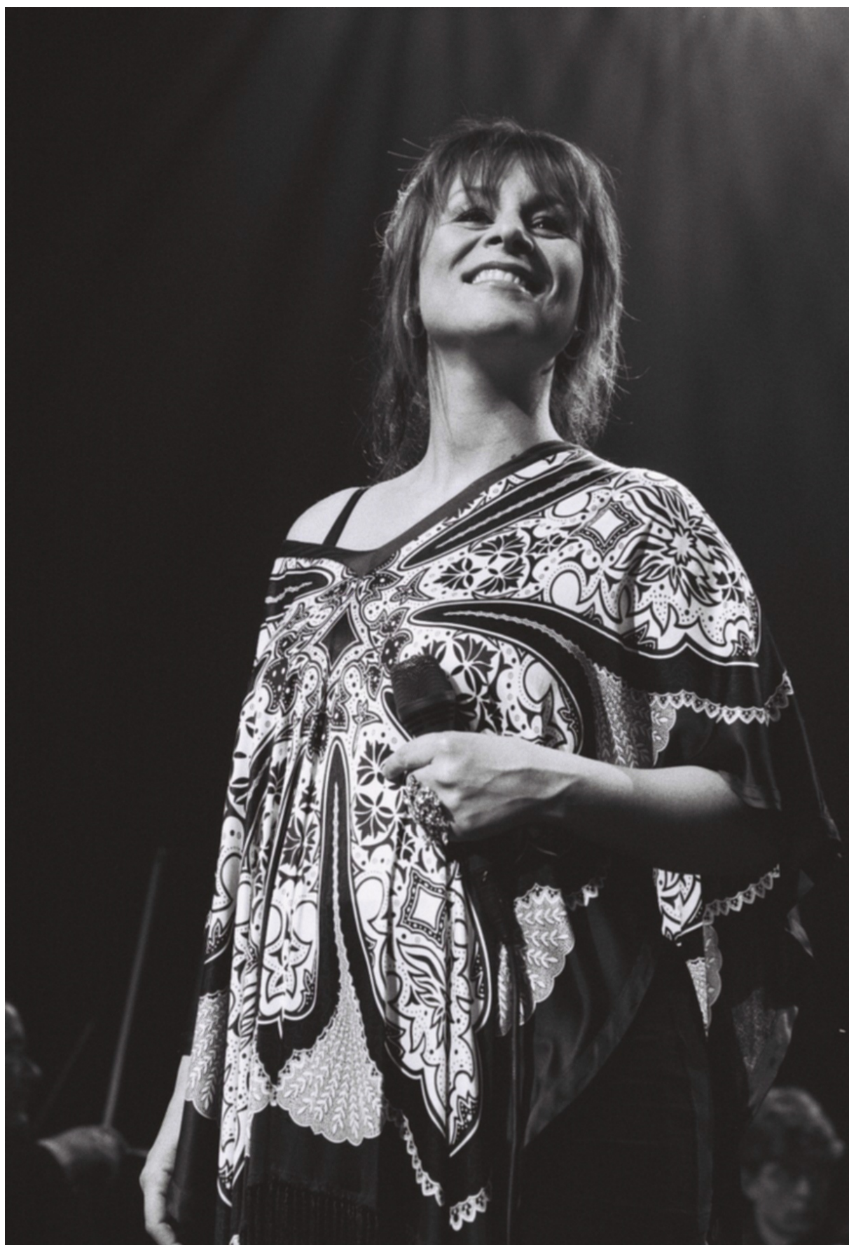
Trijntje Oosterhuis.