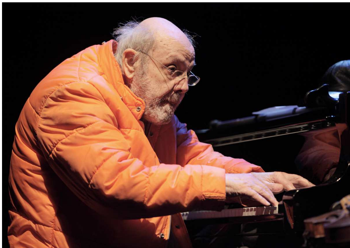
Misha Mengelberg in LantarenVenster, Rotterdam.