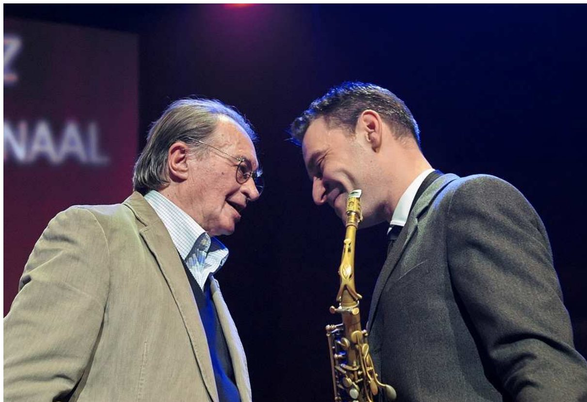
Schrijver Remco Campert (links) en Benjamin Herman in Eindhoven.