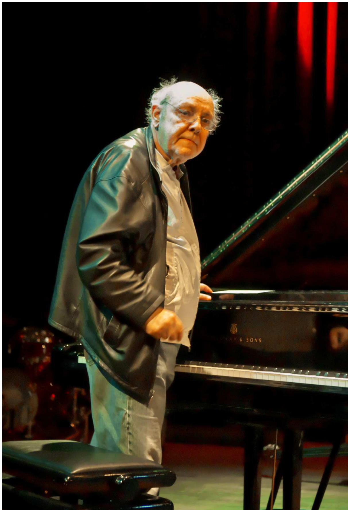
Misha Mengelberg in het Bimhuis (Amsterdam).