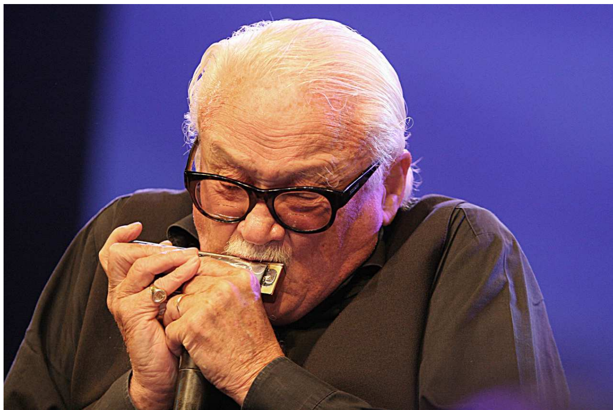
Toots Thielemans.