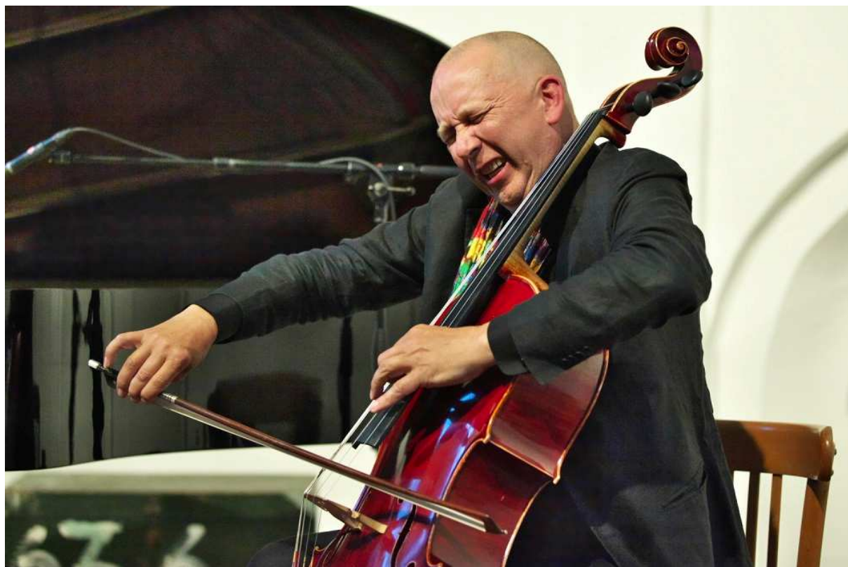
Ernst Reijseger (ZomerJazzFietsTour 2013, Groningen).