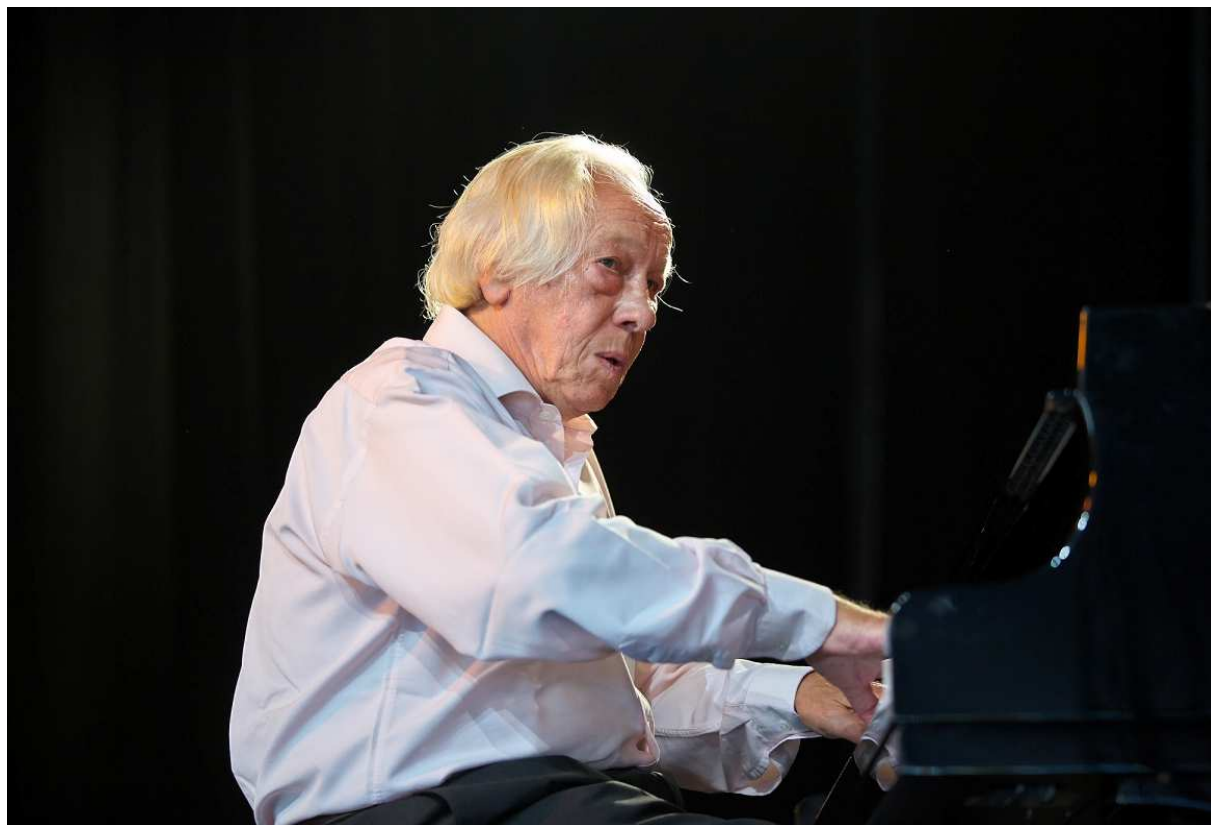
Fred Van Hove op het festival Jazz Middelheim 2011.