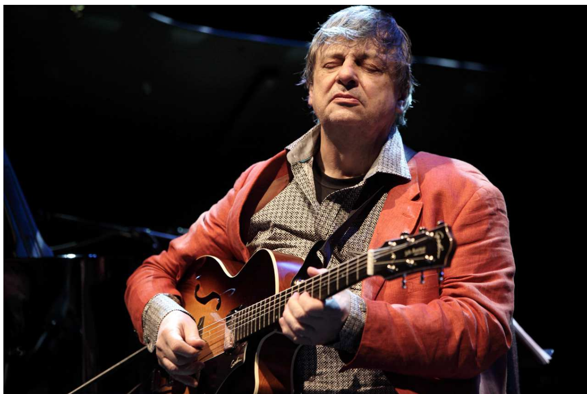
Philip Catherine in LantarenVenster, Rotterdam.