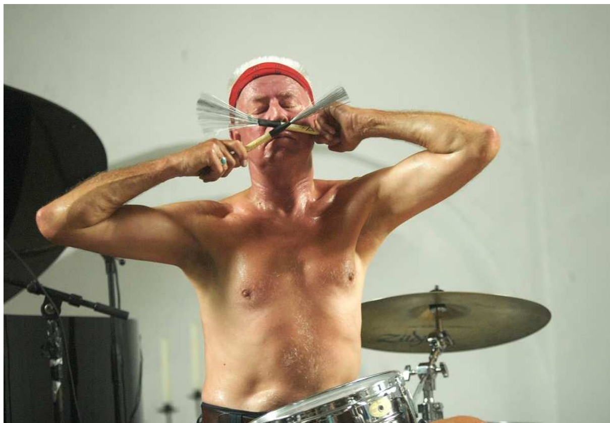
Han Bennink in Groningen (ZomerJazzFietsTour 2007).