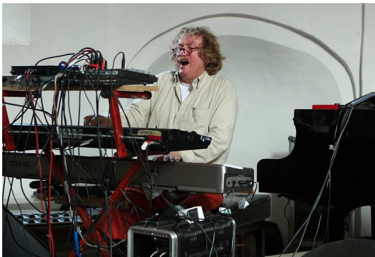
Jasper van 't Hof in Groningen (ZomerJazzFietsTour 2007).