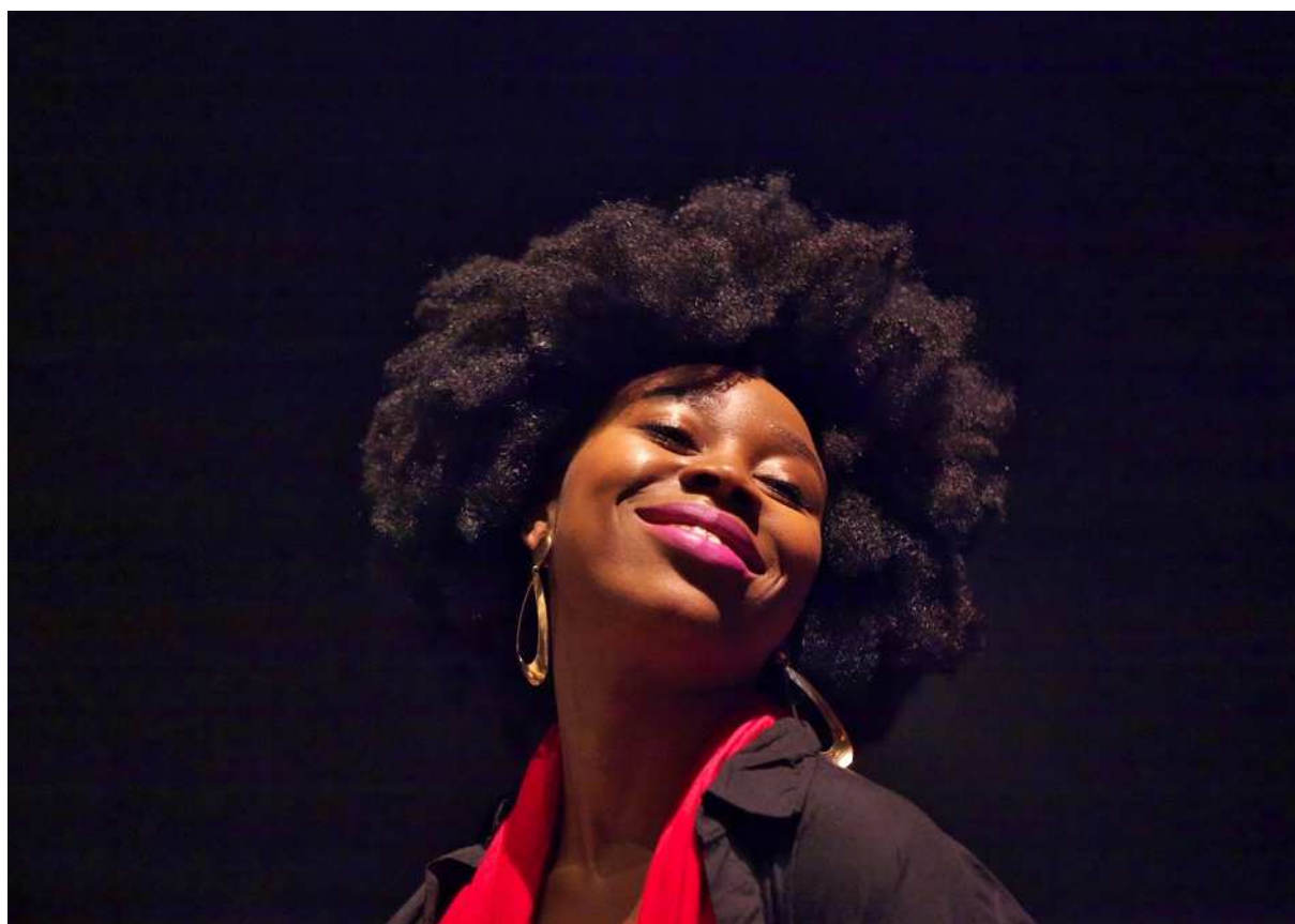
Zangeres Ntjam Rosie tijdens het evenement In Jazz, Rotterdam.