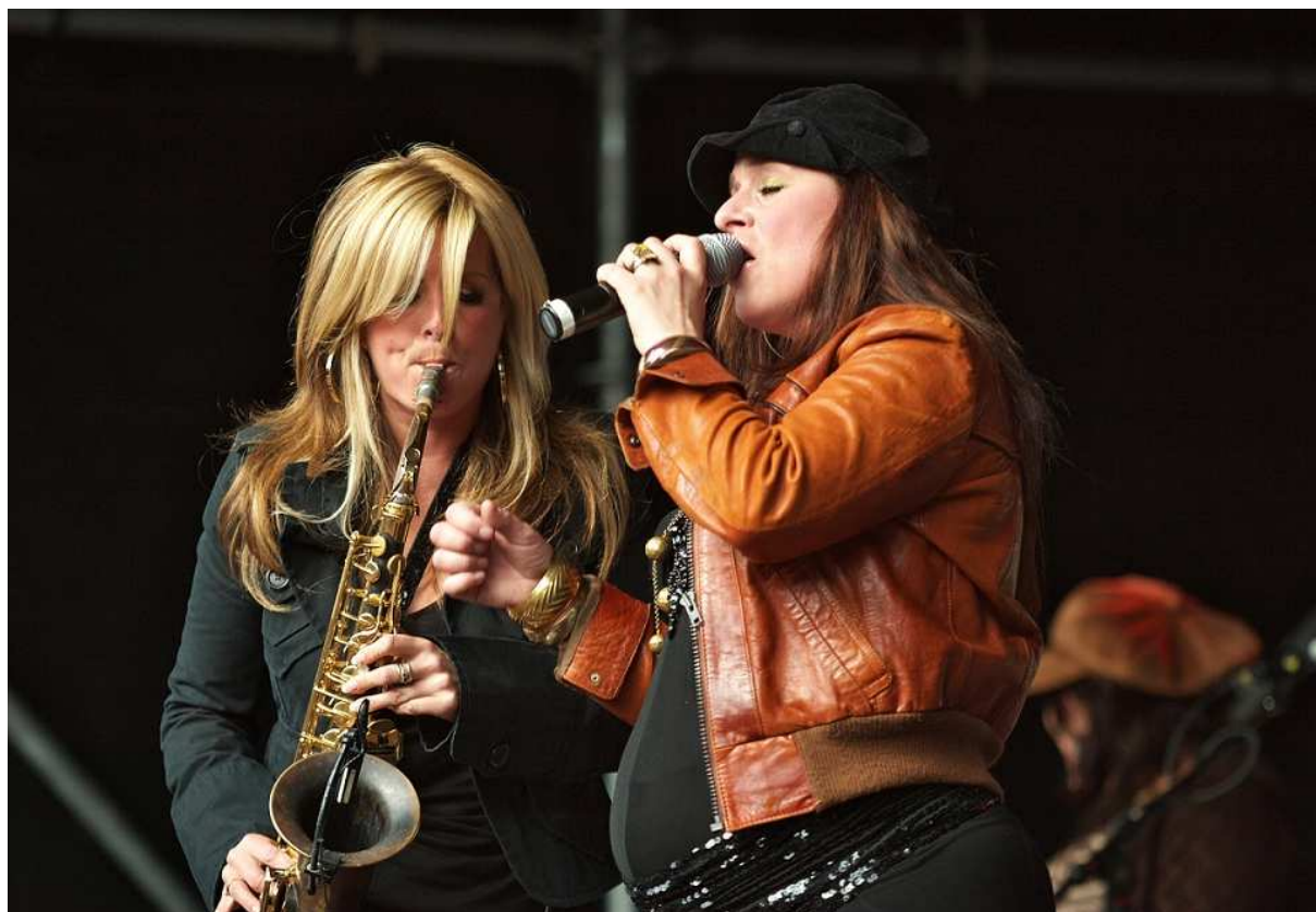
Candy Dulfer (links) en Trijntje Oosterhuis op Jazz in Duketown 2006.