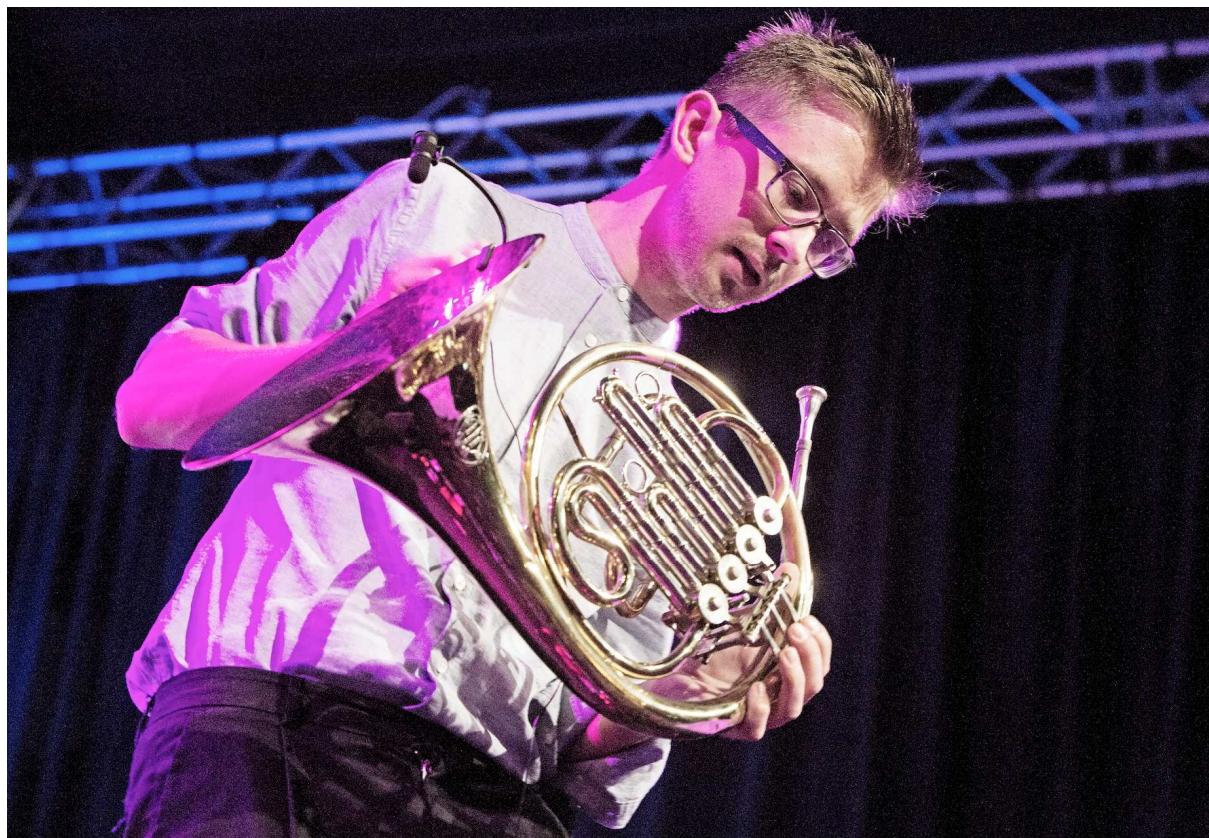
Morris Kliphuis tijdens het North Sea Jazz Festival.