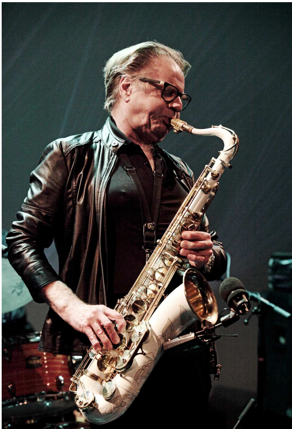
Hans Dulfer in De Melkweg, Amsterdam.