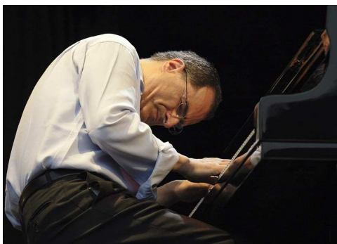
Enrico Pieranunzi. (Persfoto)

JAZZ BRUGGE FESTIVAL 2012 Sint-Janshospitaal, Concertgebouw Brugge 4, 5, 6 en 7 oktober 2012 http://www.jazzbrugge.nl