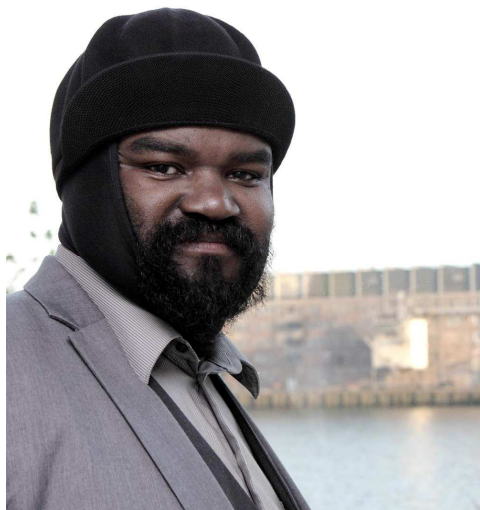
Gregory Porter.