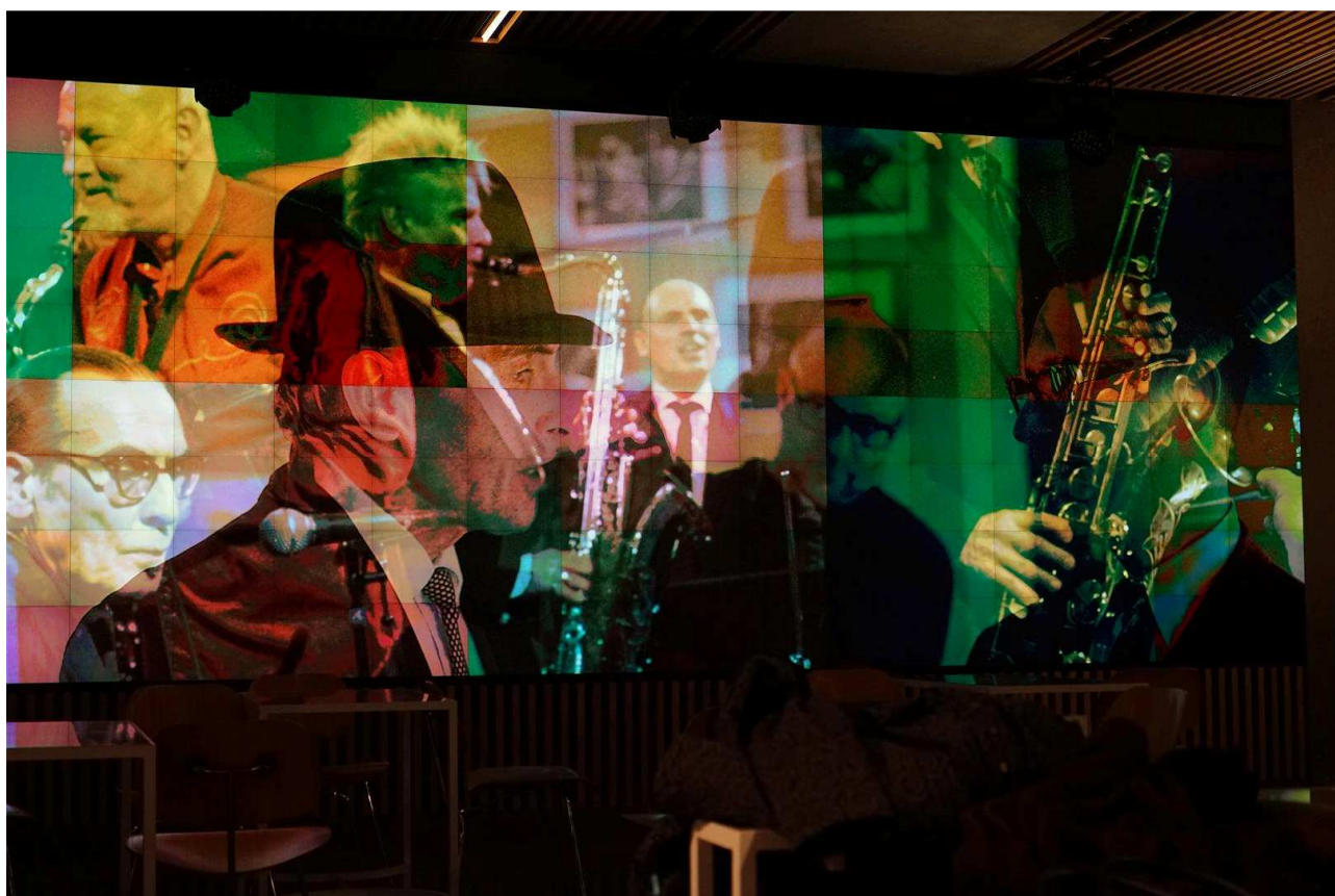
Tijdens de eerste 'Jazzy Nights' was op de mediawand de presentatie 'Jazz on stage' te zien met collages van werk van Joke Schot.