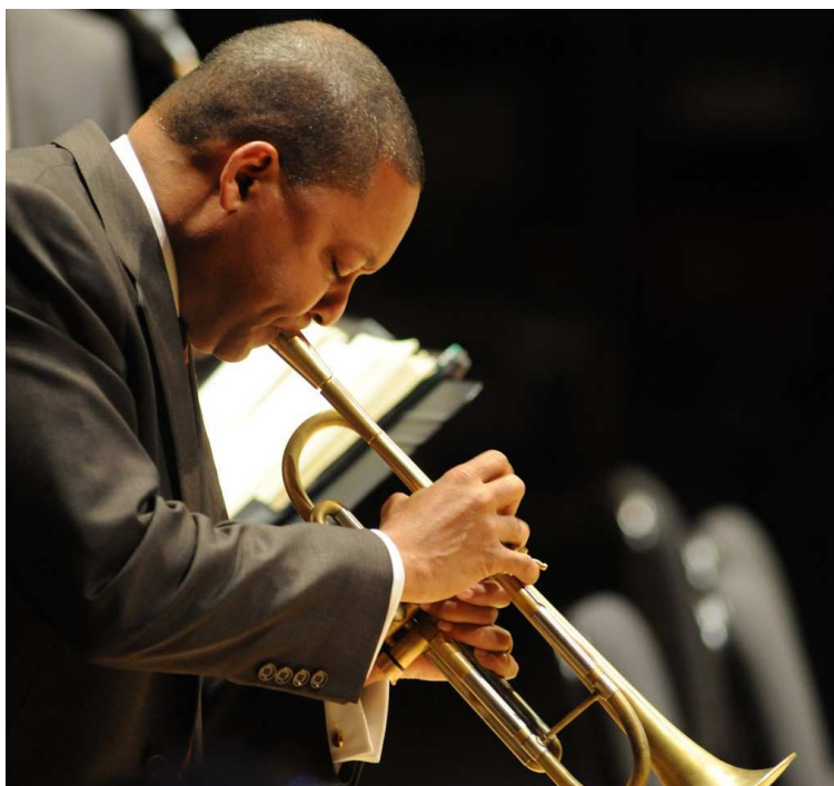
Wynton Marsalis.

Tijdens zijn bezoek aan Amsterdam voor een concert op 8 februari in het Concertgebouw, geeft trompettist Wynton Marsalis een workshop op het Vossius Gymnasium. De bigband van de school, bestaande uit zo'n dertig leerlingen, heeft voor de gelegenheid een stuk van George Gershwin ingestudeerd.