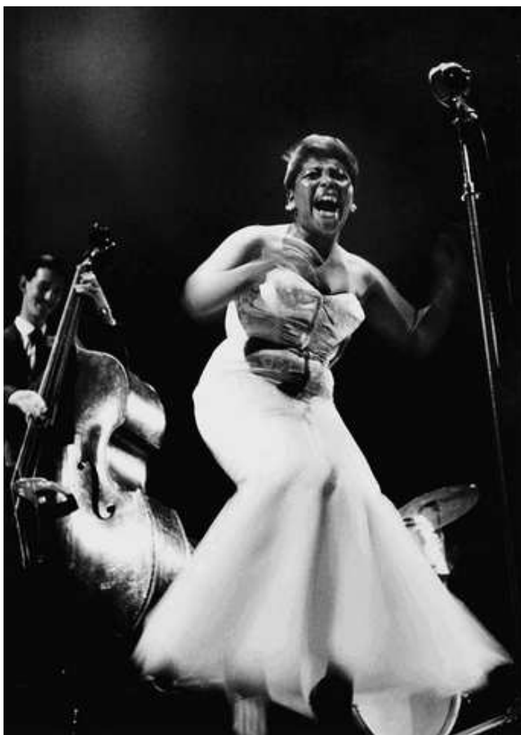
Bertice Reading en Ruud Jacobs, Concertgebouw, 9 juni 1957