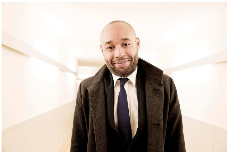
Aaron Diehl in de wandelgang van LantarenVenster.

Diehl werd klassiek opgeleid en is daardoor in staat om naast zijn technisch vernuft, frases te citeren uit het werk van componisten als Chopin, Liszt en Ravel. Van Philip Glass speelt hij een etude. Ook van Dick Hyman brengt hij enkele korte 'leerstukken'. Zijn fluwelen spel in 'A story often told, seldom heard' van Roland Hanna wordt gevolgd door delicate swing in 'Odd number' van Hank Jones. Tussen de bedrijven door haalt Diehl nog even uit met een staaltje stride piano in 'Carolina Shout' van James P. Johnson, uit 1923.