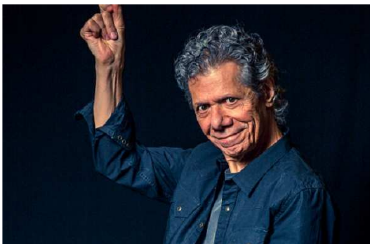
Werk van Chick Corea heruitgegeven.