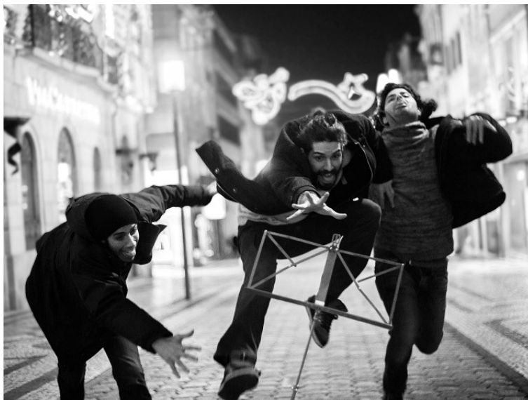
The Rite of Trio uit Portugal verzorgt een showcase tijdens de European Jazz Meeting op Jazzahead!.