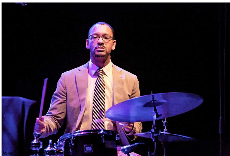
Jason Marsalis.

Op drums is zijn stijl alert en scherp. Op een terughoudende manier vormde hij een robuuste ruggengraat in het ensemble. Zijn solo's waren sober en eenvormig.