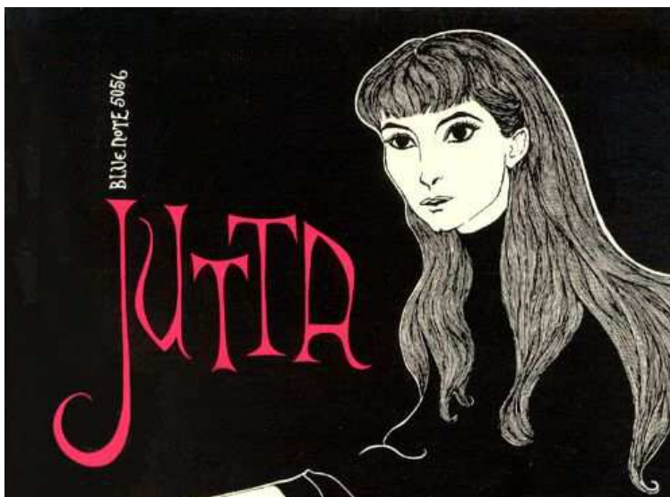
De hoes van de Blue Note-elpee 'New Faces-New Sounds From Germany', opgenomen in 1954, uitgebracht in 1956.