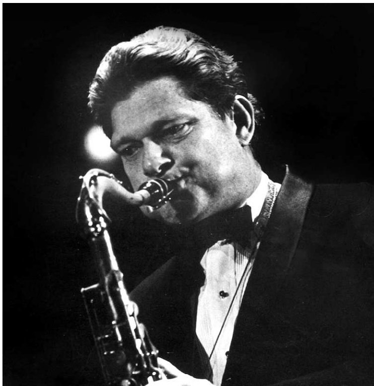
Zoot Sims.

Klik hier voor de website: www.myjazzmoments.com