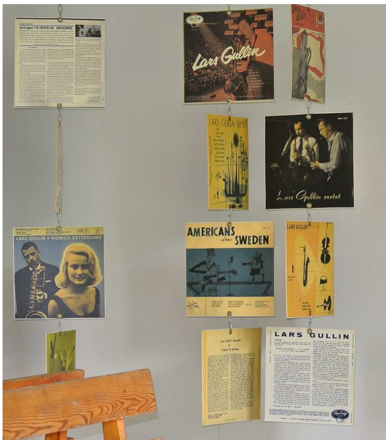
Een blik in het Museum Lars Gullin.

https://www.youtube.com/watch?v=IGU5wbXIhX0