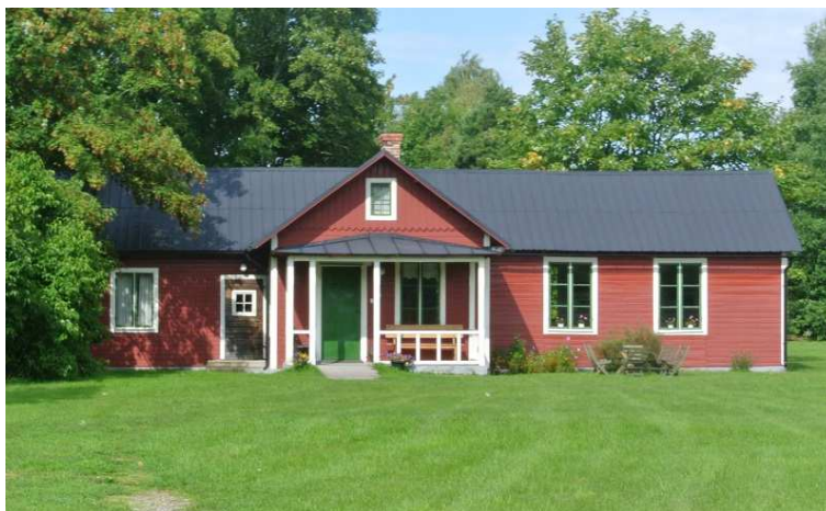
Museum Lars Gullin in Sanda (Zweden).