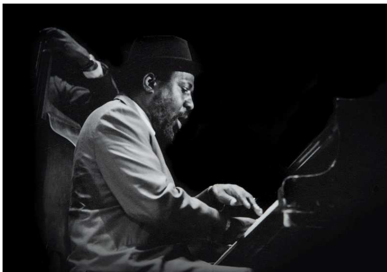
Thelonious Monk.