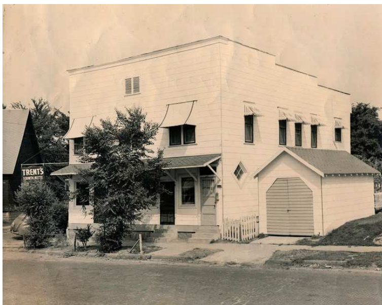
Een foto van de likeurenwinkel die Trent in de jaren vijftig in Fort Smith, Arkansas opende.