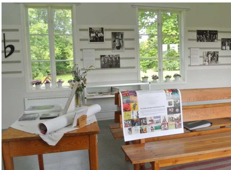
De entree van het museum.