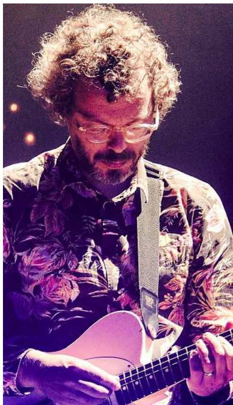
Jakob Bro.