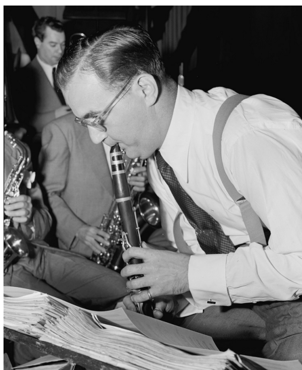
Benny Goodman, 400 Restaurant, NY, ca. juli 1946.