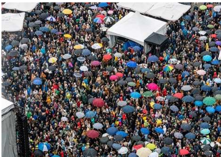
Het publiek op de Parade trotseert de regen op de laatste avond van Jazz in Duketown.

Heeft u jazznieuws? Stuur het ons: jazzflits@gmail.com .