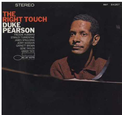
Duke Pearson, 'The Right Touch'.

Pearson is ook componist: 'Sweet honey bee', 'New girl', 'My love waits' zijn songs voor of over vrouwen, 'Cristo redentor', 'Noah', 'Walk children' zijn religieus. 'New time shuffle', 'Chili peppers', 'The phantom' zijn jazzstukken. Ook nog: 'The fakir', 'Prairie dog', 'Le carrousel'.