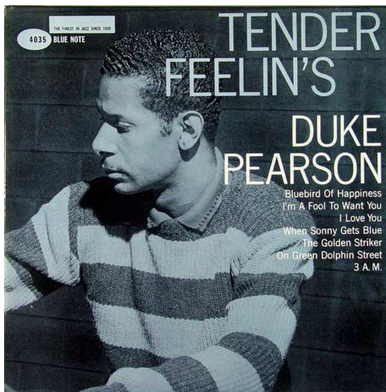
Duke Pearson op een Blue Note-platenhoes.

Na twee jaar afwezigheid is Pearson eind 1972 opnieuw in New York met een nieuwe bigband.