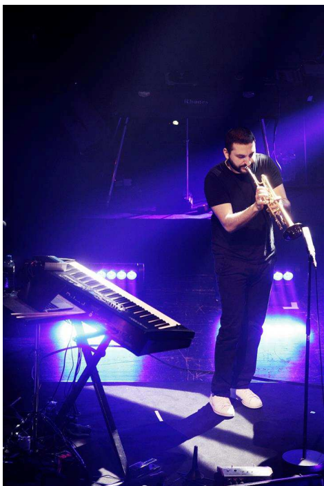
Trompettist Ibrahim Maalouf treedt op tijdens Gent Jazz.