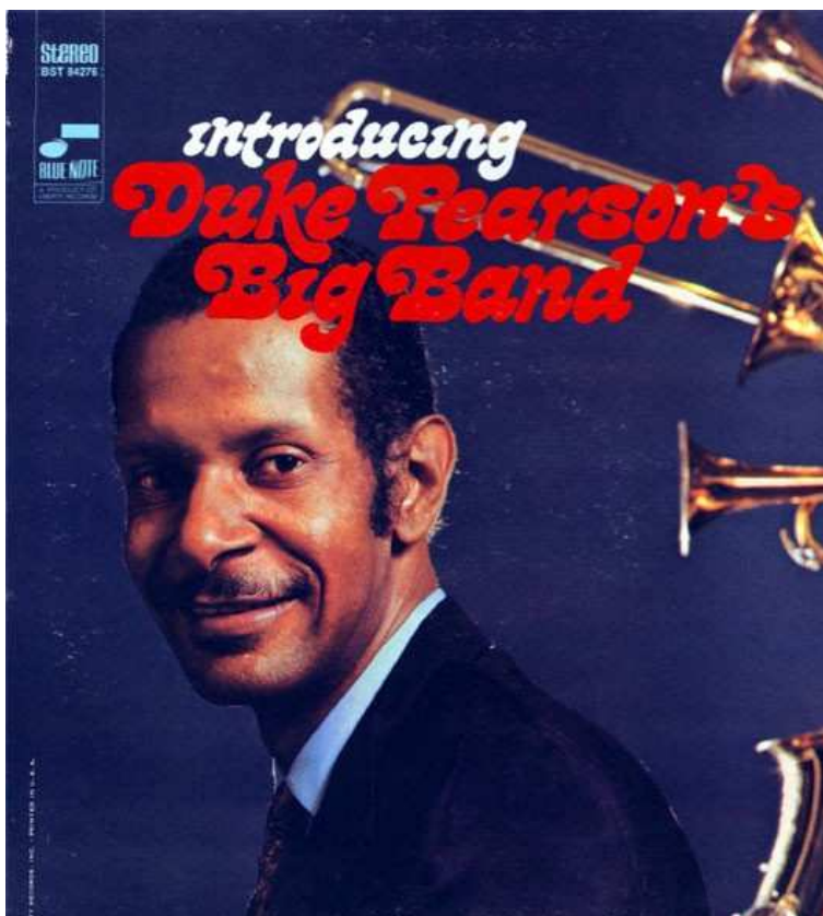
Duke Pearson op een Blue Note-platenhoes.

Lee Morgan vertolkt dat stuk op 'The Rajah' met Hank Mobley (sax), Cedar Walton (piano), Paul Chambers (bas), Billy Higgins (drums), op 29 november 1966, voor Blue Note BST 84426. 'The Magilla' van Pearson staat op 'The Spoiler' van saxofonist Stanley Turrentine (1934-2000), met Pepper Adams, opgenomen 22 september 1966. Stanley was getrouwd met orgeliste Shirley Scott (1934-2002) (Blue Note 84256).