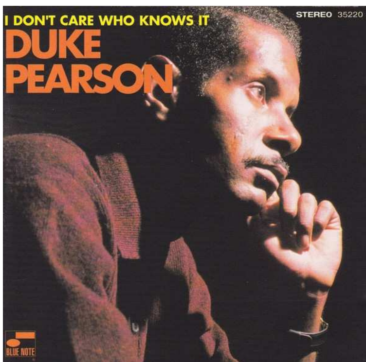
Duke Pearson op een Blue Note-platenhoes.

Ook zijn ouders waren aanwezig. Sindsdien is in Atlanta 'Augustus' de Jazz Maand bij uitstek. In het Central City Park en het Piedmont Park speelden Milt Jackson, Lou Donaldson, Grady Tate, Bob Cranshaw, Monty Alexander ter nagedachtenis van hun muzikale vriend.