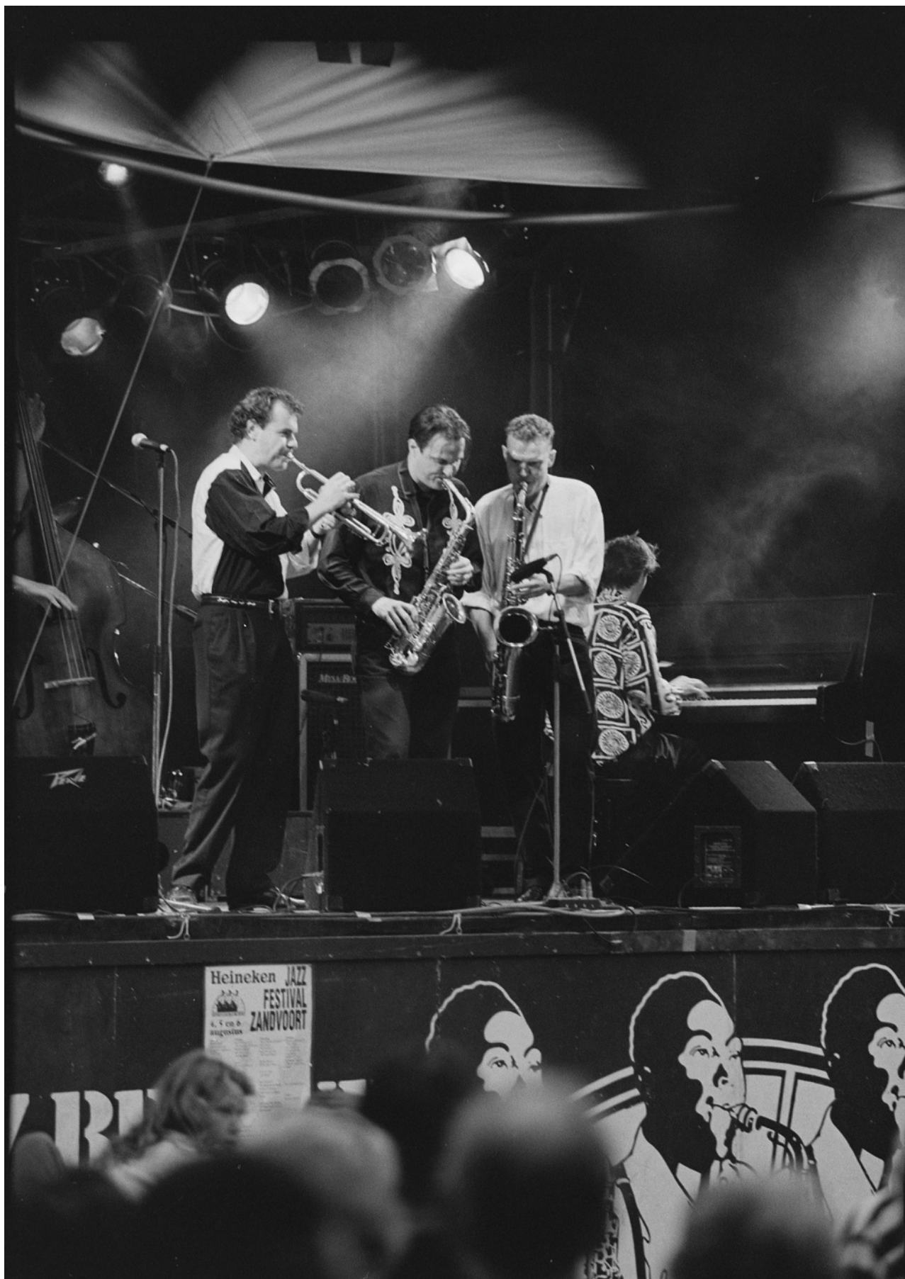
The Houdini's op 4 augustus 1995 tijdens het Jazz Festival Zandvoort.