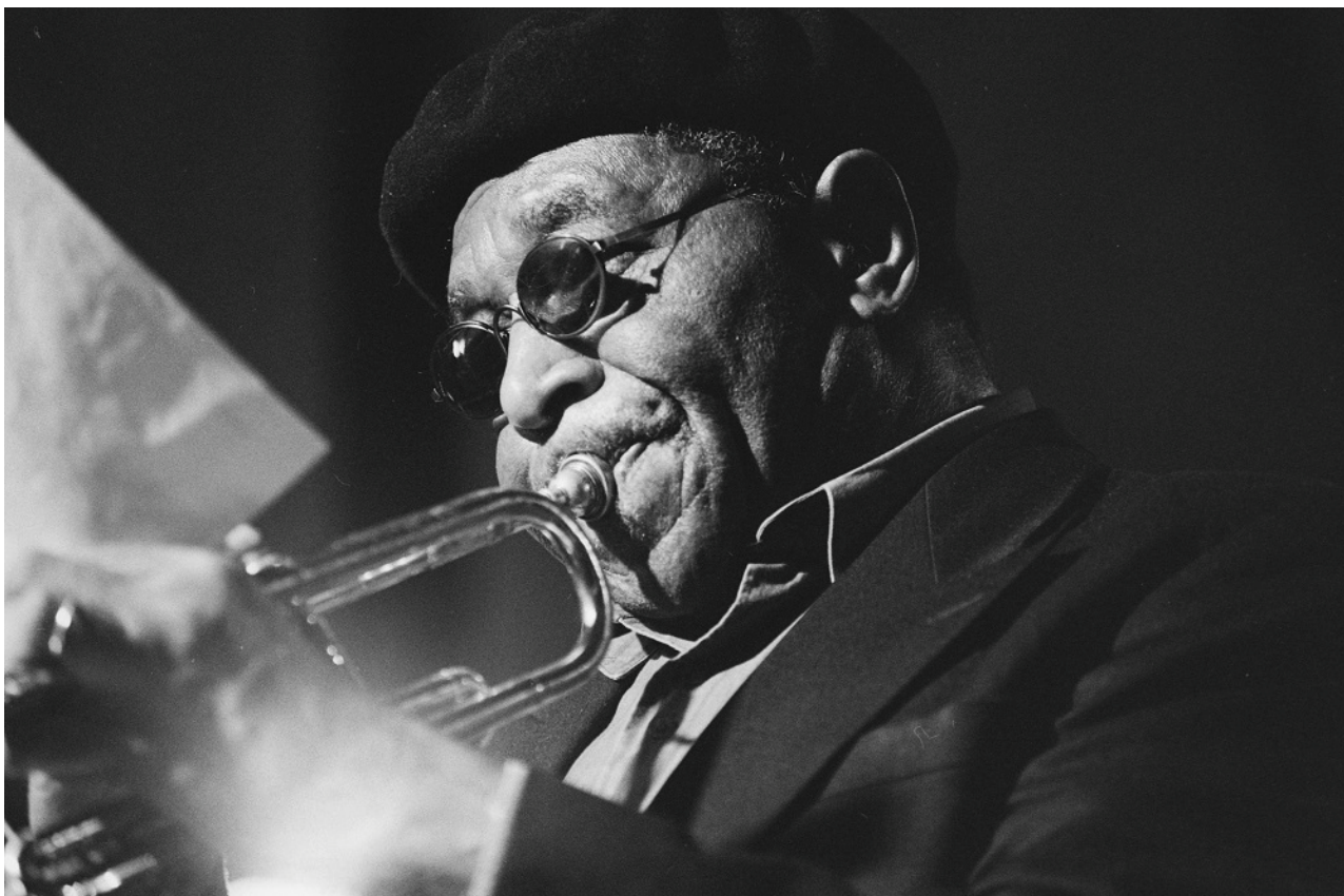
Benny Bailey, Haarlemse Jazzclub, 24 augustus 1994.