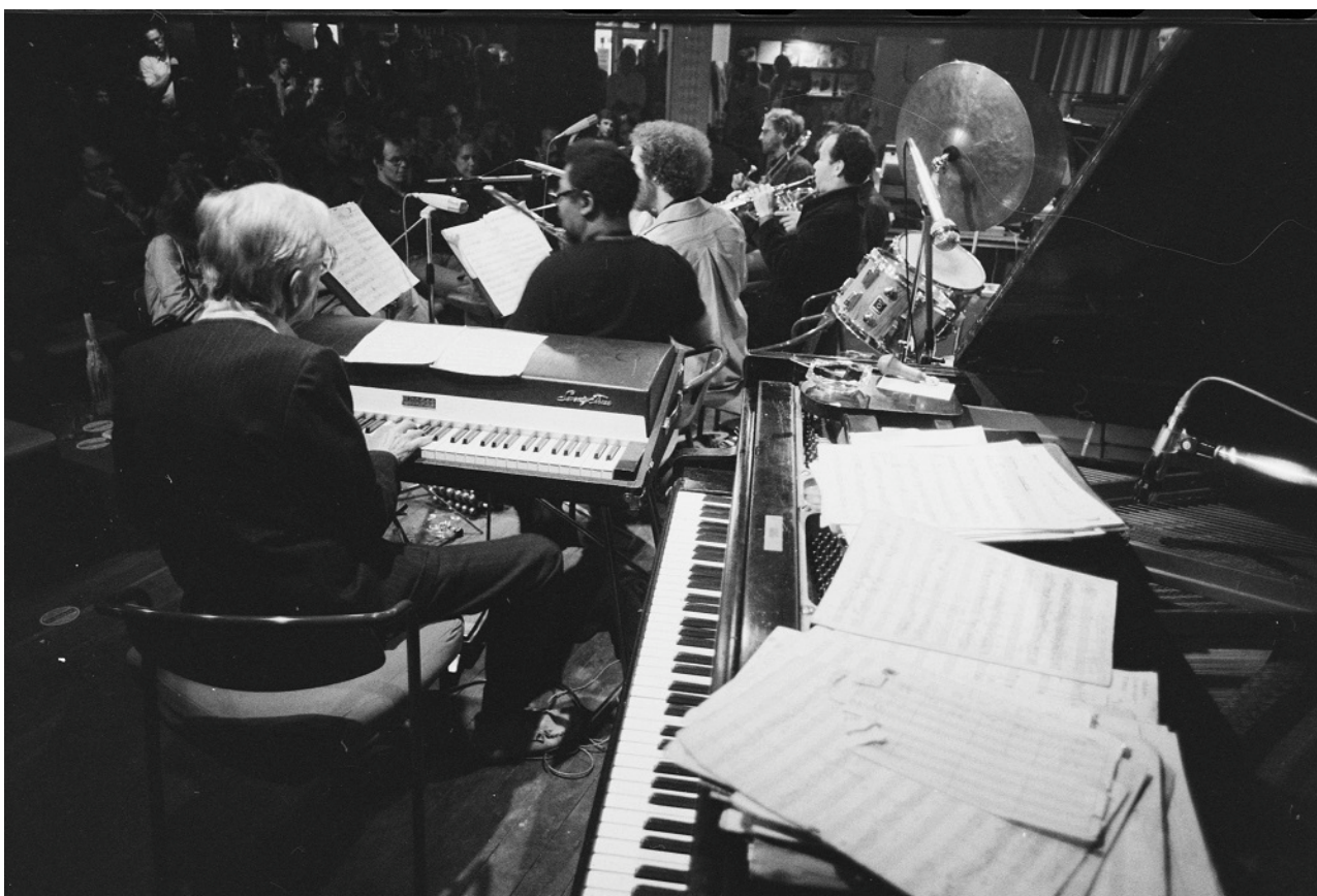
Gil Evans en zijn formatie in de Haarlemse Jazzclub op 28 oktober 1978.