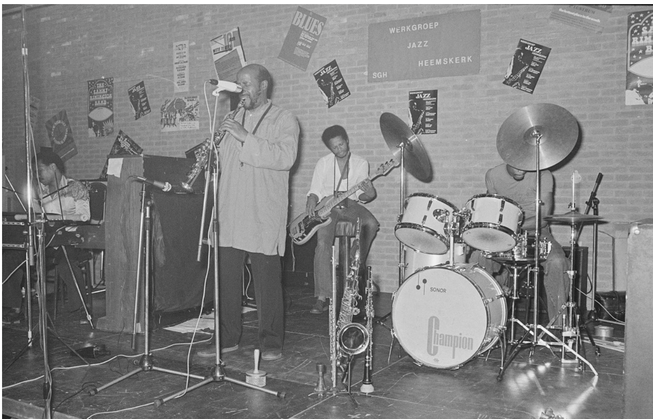
Yusef Lateef op 28 september 1980 te gast bij de Werkgroep Jazz Heemskerk.