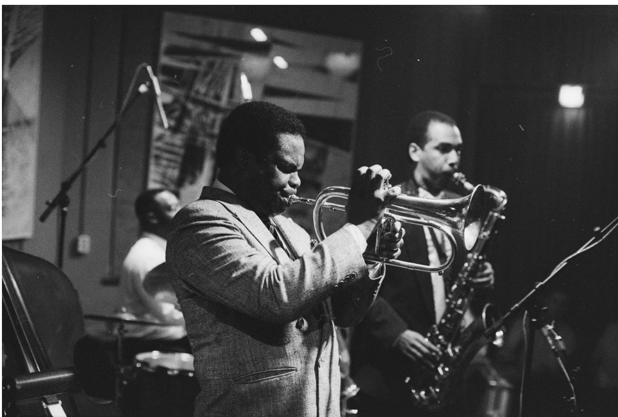
Freddie Hubbard in de Haarlemse Jazzclub op 12 oktober 1989.