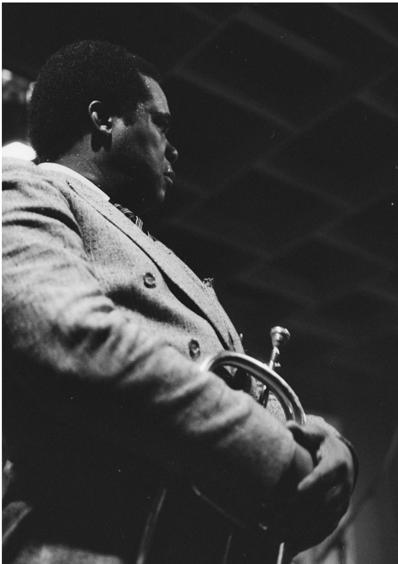
Freddie Hubbard in de Haarlemse Jazzclub op 12 oktober 1989.