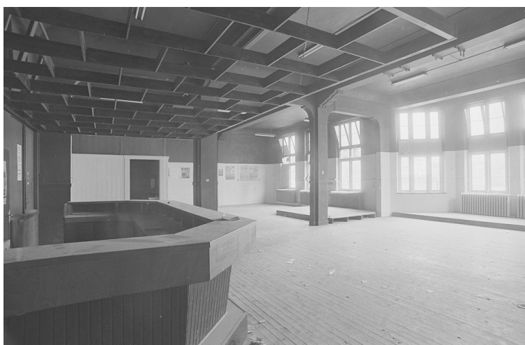
Interieur Haarlemse Jazzclub (Zanderzaal) medio 1976. De club was gelegen aan de Gasthuisvest/Groot Heiligland.

Actuele berichten en concertaankondigingen vindt u op: https://www.facebook.com/Jazzflits