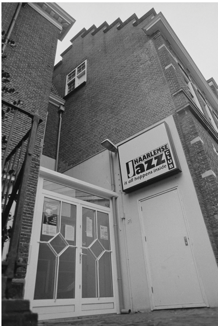
Entree van de Haarlemse Jazzclub eind 1994.

Bijdragen: JAZZFLITS behoudt zich het recht voor om bijdragen aan te passen of te weigeren. Het inzenden van tekst of beeld voor publicatie impliceert instemming met plaatsing zonder vergoeding. Rechten: Het is niet toegestaan zonder toestemming tekst of beeld uit JAZZFLITS over te nemen. Alle rechten daarvan behoren de makers toe. Vrijwaring: Aan deze uitgave kunnen geen rechten worden ontleend.