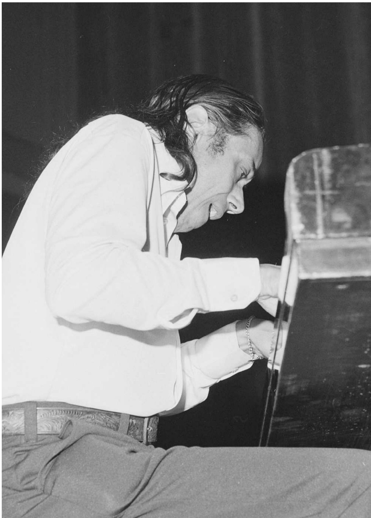
Horace Silver in Haarlem, waarschijnlijk in het Concertgebouw (24 maart 1979).