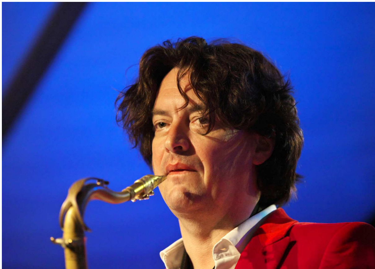
Yuri Honing tijdens het festival Jazz in Duketown.