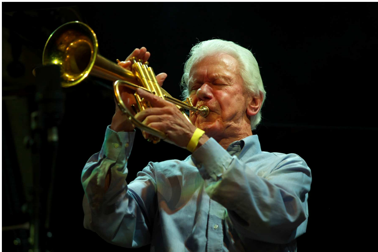
Ack van Rooyen tijdens het festival Late Summer Jazz in Uden.