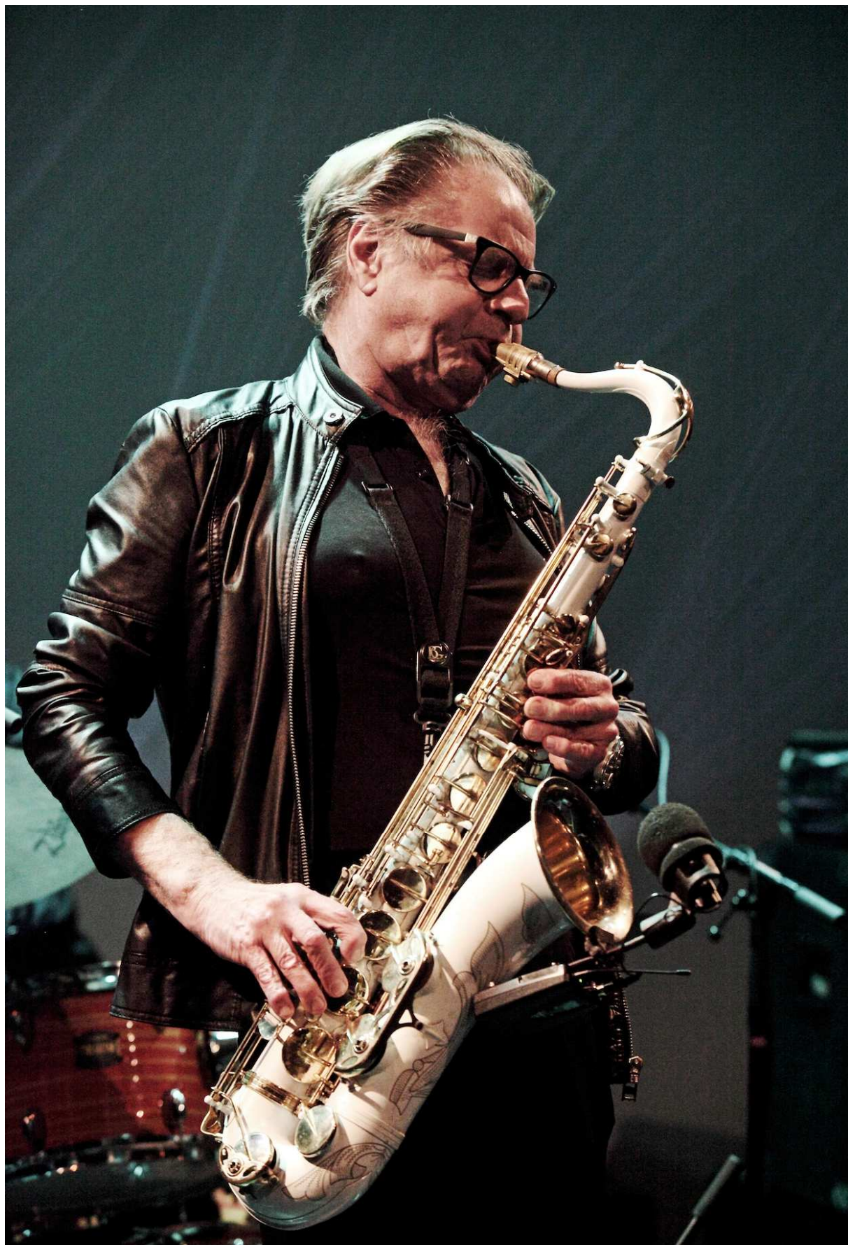
Hans Dulfer in De Melkweg, Amsterdam.