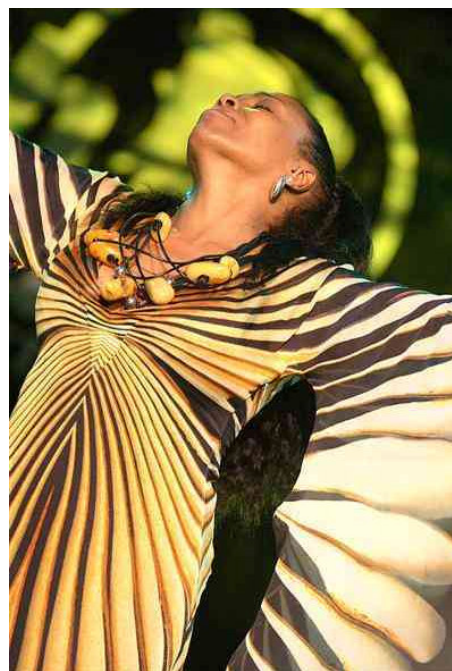
Zangeres Dee Dee Bridgewater trad zaterdag op.