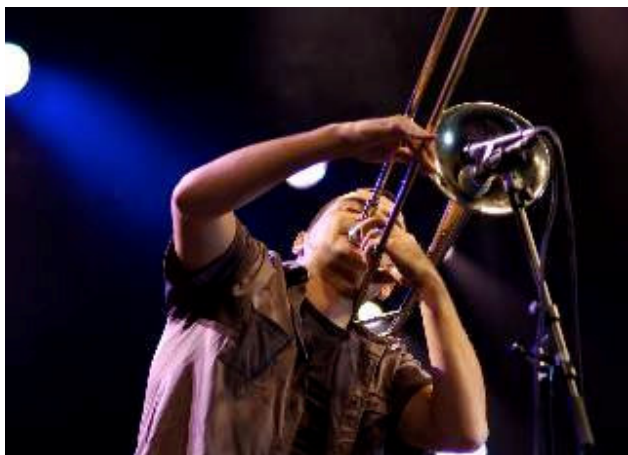
De Italiaanse trombonist Gianluca Petrella (foto) werd vorig jaar door Downbeat als het grootste talent op zijn instrument gekozen. Voor Blue Note Records maakte hij het album 'Indigo 4'. Op het festival opende hij zaterdag 7 juli om 17.00 uur de tweede dag.