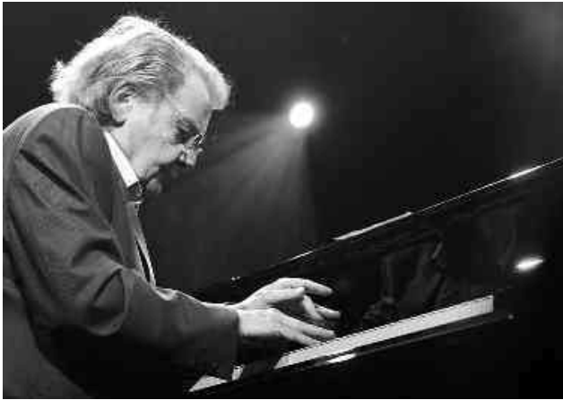
Stan Tracey

De Engelse pianist Stan Tracey was eindelijk weer eens in Nederland. Vanwege het album 'The London Session', dat Tracey met Benjamin Herman maakte, trad zijn kwartet samen met de altist op voor een uitzinnig publiek. Waarschijnlijk kwam de meerderheid van het publiek voor de saxofonist. Maar de pianist (80!) is een meester in de stijl van Thelonious Monk. Met zijn percussieve spel begeleidde hij Herman en de Engelse trompettist Guy Barker. De twee jonge musici brachten vlotte jazz. 'Drop me of in Harlem' van Tracy was een vrolijk thema voor trompet en sax. De bassist ondersteunde het stuk heel progressief. De zondag was hiermee geopend en kon meteen al niet meer stuk.