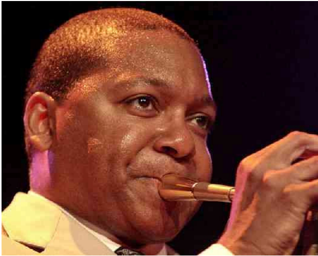
Wynton Marsalis