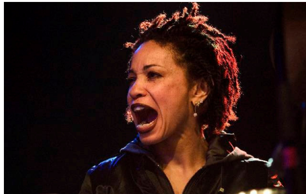
Drummer Cindy Blackman trad 6 juli op als lid van het Kenny Werner Quintet.