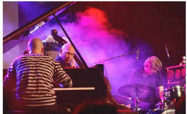
E.S.T.