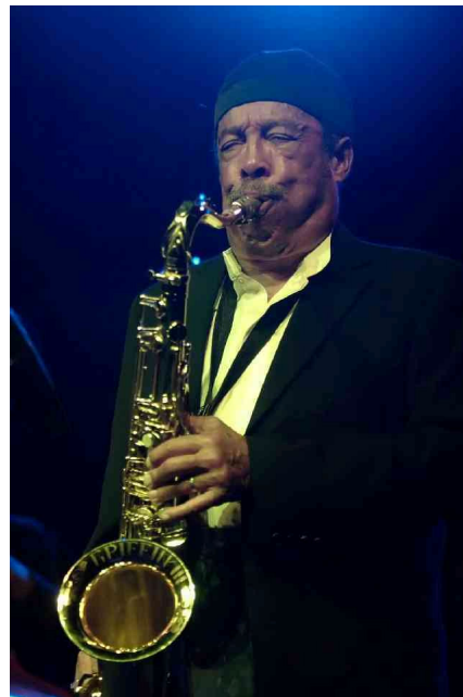
Johnny Griffin