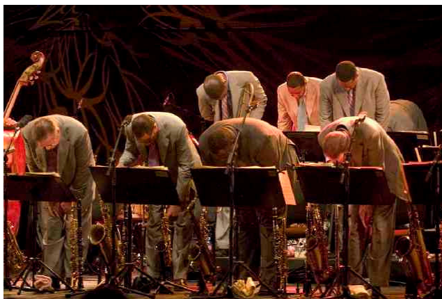
Trompettisten waren goed vertegenwoordigd op het festival. Wynton Marsalis (achterste rij midden) – hij maakt zijn platen voor Blue Note Records – speelde zaterdag met zijn Lincoln Center Jazz Orchestra (LCJO).