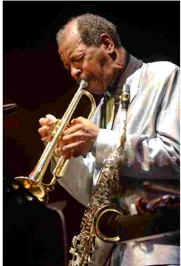
Ornette Coleman