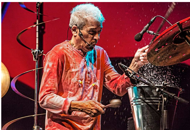
Trilok Gurtu.

Sterren, opkomend talent, outsiders en avant-garde brachten ons een overvloed van ideeën en inspiraties.